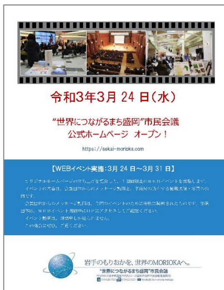
（R2 市民会議推進イベント） 盛岡の市民運動の力を世界に発信しよう