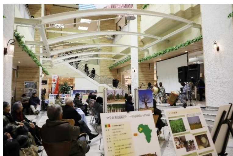
（R1 市民会議推進大会） ホストタウンの相手国を知ろう