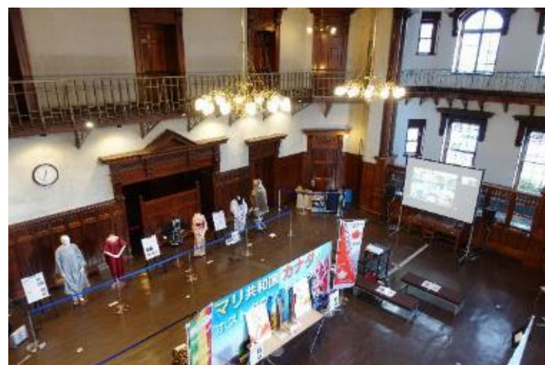
（R3 市民会議推進イベント） With コロナ With ホストタウン