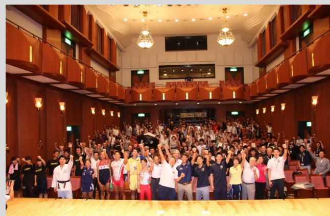
【スポーツの力が盛岡の未来を創る！希望郷いわて国体・いわて大会を成功させよう】